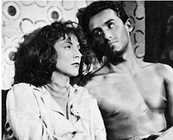
1947 LE JUIF ERRANT (L'Ebreo errante) de Goffredo Alessandrini avec Vittorio Gassman