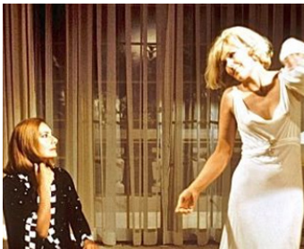
1968 LE DÉMON DES FEMMES (The Legend of Lylah Care) de Robert Aldrich avec Kim Novak