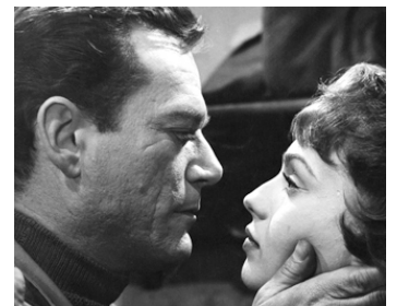
1954 REPRIS DE JUSTICE (Avanzi di galera) de Vittorio Cottafavi avec Eddie Constantine