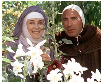
1971 FRANÇOIS ET LE CHEMIN DU SOLEIL (Brother Sun, Sister Moon) de F. Zeffirelli avec Lee Montague