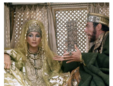
1976 JÉSUS DE NAZARETH (Gesù di Nazareth) de Franco Zeffirelli avec Christopher Plummer