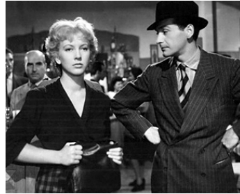
1946 UN AMÉRICAIN EN VACANCES (Un Americano in vacanza) de L. Zampa avec Andrea Cecchi