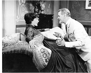
1962 L'ODYSSÉE DU DR MUNTHE (Axel Munthe) de Rudolf Jugert avec O. W. Fischer