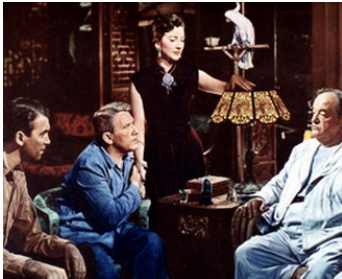
1949 MALAYA (Malaya) de Richard Thorpe avec J. Stewart, Spencer Tracy, S. Greenstreet