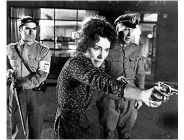
1963 LA RANCUNE (The Visit) de Bernhard Wicki avec Jacques Dufilho, Hans Christian Blech