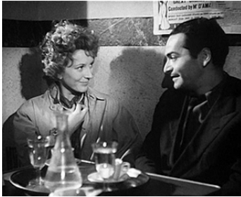
1945 LA NUIT PORTE CONSEIL (Roma città libera) de M. Pagliero avec Andrea Cecchi