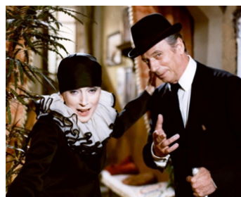
1976 LE GRAND ESCOGRIFFE de Claude Pinoteau avec Yves Montand