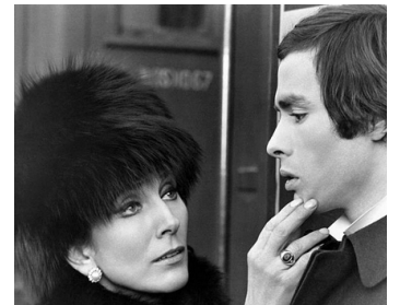
1967 ET SI ON FAISAIT L'AMOUR ? (Seusi, facciamo l'amore) de Vittorio Caprioli avec Pierre Clementi