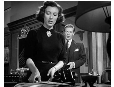
1950 LA MAISON SUR LA COLLINE (The House of Telegraph Hill) de R. Wise avec R. Baschart