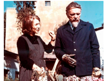
1971 L'ASSASSINAT DE TROTSKY de Joseph Losey avec Richard Burton