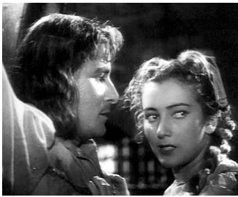
1941 LA FARCE TRAGIQUE (La cena delle beffe) d'Alessandro Blasetti avec Amedeo Nazzari