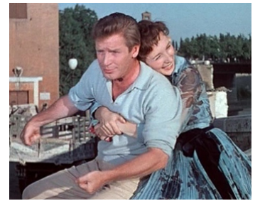
1958 AMOUR ET ENNUIS (Amore e guai) d'Angelo Dorigo avec Richard Basehart