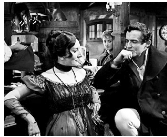
1956 KEAN (Kean, genio e regolattezza) de Vittorio Gassman avec V. Gassman