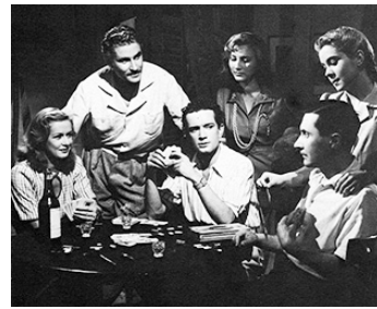
1942 LA FOLLE JOURNÉE (Giorni felici) de Gianni Franciolini avec A. Nazzari, L. Cortese, P. Stoppa