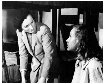
1949 FEMMES SANS NOM (Donne senza nome) de Geza von Radvanyi avec Simone Simon