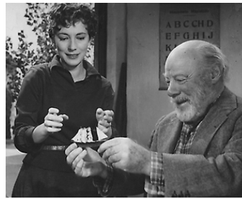
1956 CALABUG (Calabuch) de Luis Garcia Berlanga avec Edmund Gwenn