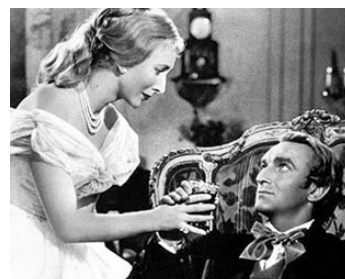
1955 WAGNER ET LES FEMMES (Magic Fire) de William Dieterle avec Alan Badel