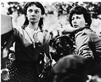
1952 THE SECRET PEOPLE de Thorold Dickinson avec Audrey Hepburn