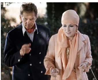
1973 LA NUIT AMÉRICAINE de François Truffaut avec Jean-Pierre Aumont