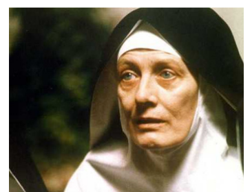
1992 MÉMOIRE D'UN SOURIRE (Storia di una capinera) de Franco Zeffirelli