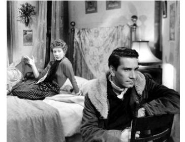
1949 LES BAS-FONDS DE FRISCO (Thieve's Highway) de Jules Dassin avec Richard Conte