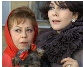
1965 JULIETTE DES ESPRITS (Giulietta degli spiriti) de Federico Fellini avec Giuletta Masina