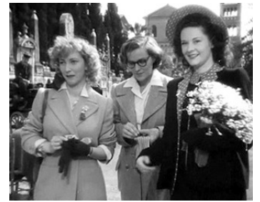
1944 ON NE PEUT PAS REVENIR EN ARRIÈRE (Nessuno torna in dietro) d'Alessandro Blasetti