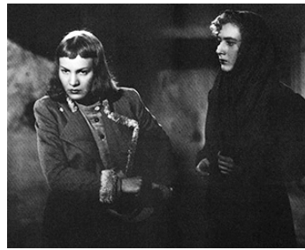
1942 HORIZON DE SANG (Orizzonte di sangue) de Gennaro Righelli avec Luisa Ferida