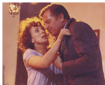
1974 LES PASSIONNÉS (Appassionata) de Gianluigi Calderone avec Gabriele Ferzetti