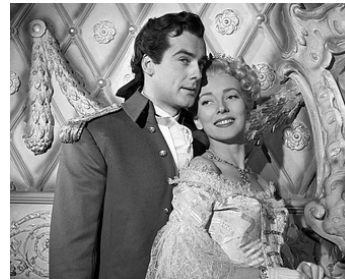
1950 À L'OMBRE DE L'AIGLE (Shadow of the Eagle) de Sidney Salkow avec Richard Greene