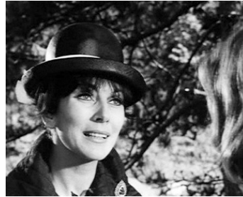
1962 LA FILLE QUI EN SAVAIT TROP (La Ragazza che sapeva troppo) de Mario Bava