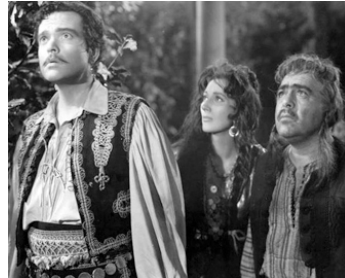
1948 CAGLIOSTRO (Black Magic) de Gregory Ratoff avec Orson Welles, Akim Tamiroff