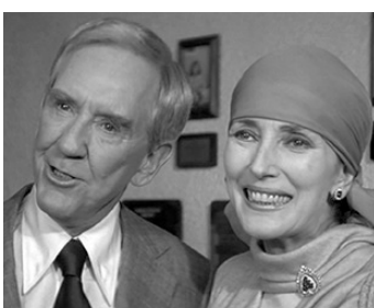
1979 LE JOUR DE LA FIN DU MONDE (The Day the world ended) de J. Goldstone avec B. Meredith