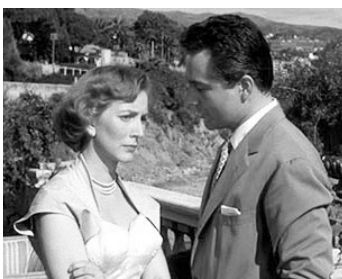
1954 LA COMTESSE AUX PIEDS NUS (The Barefoot Contessa) de J. Mankiewicz avec Rossano Brazzi