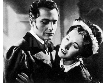
1947 LE ROUGE ET LE NOIR (Il Corriere del Re) de Gennaro Righelli avec Rossano Brazzi