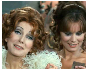
1969 LES CAPRICES DE MARIE de Philippe de Broca avec Marthe Keller