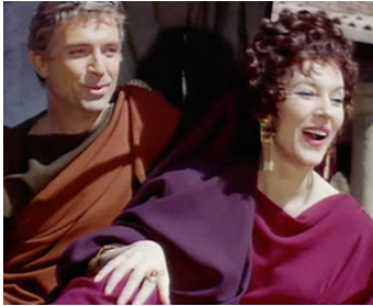
1961 BARABBAS (Barabba) de Richard Fleischer avec Norman Wooland