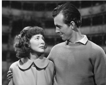
1948 LA MONTAGNE DE VERRE (The Glass Mountain) de Henry Cass avec Michael Denison