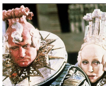
1988 LES AVENTURES DU BARON MÜNCHAUSEN de Terry Gilliam avec Robin Williams